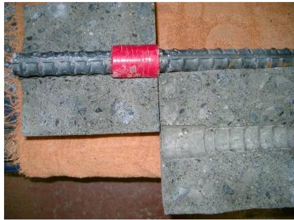
付着応力度測定後の破断面